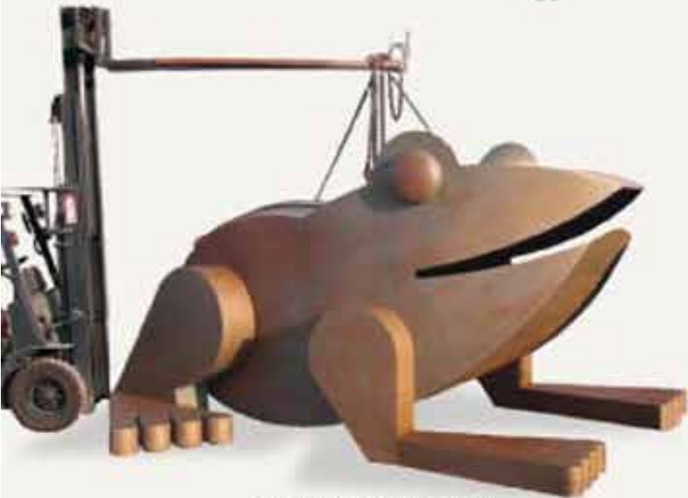
Création mobilier urbain