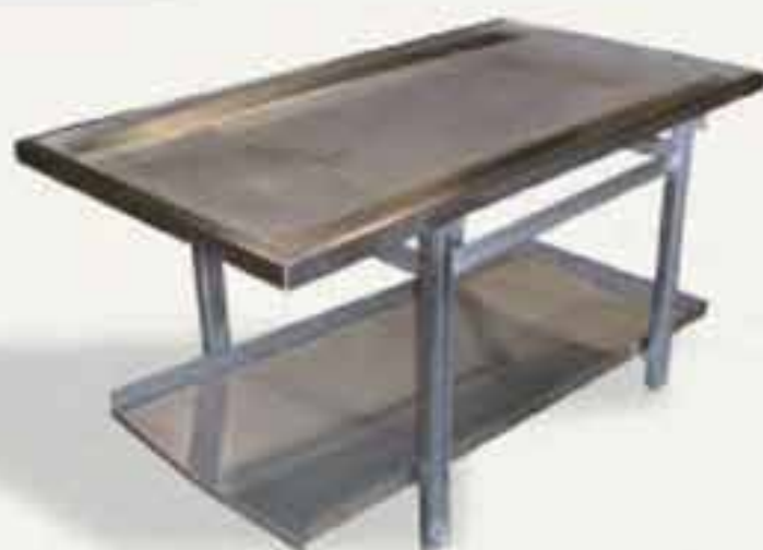
Plan de travail alimentaire