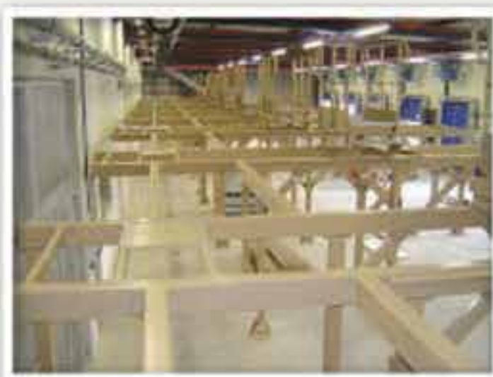
Fabrication et installation d'une plateforme métallique

L'activité de la métallerie est très diversifiée. Nous proposons à nos clients une large gamme de produits, que ce soit pour la réalisation de charpente métallique, châssis tubulaire pour bâti machine ou même de portail autoportant.