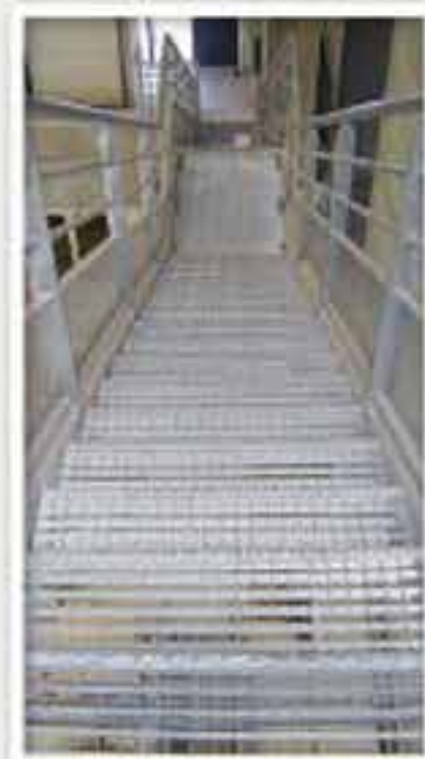
Escalier de service industriel