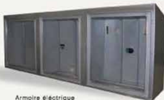
Armoire électrique pour laveuse industrielle