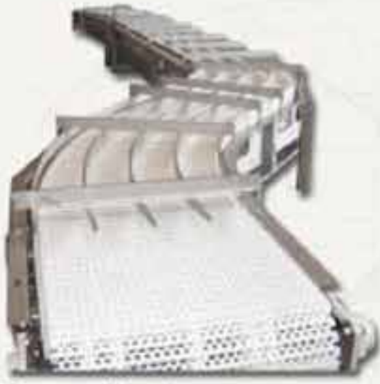
Convoyeur à tapis