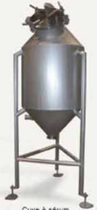
Cuve à sérum