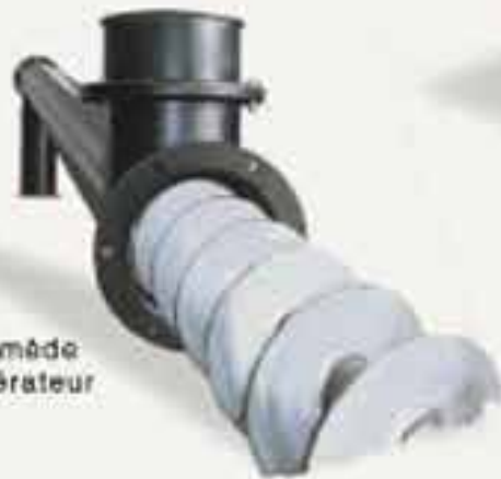
Vis d'Archimède pour incinérateur