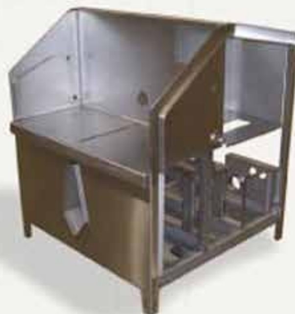
Bâti pour machine découpe jet d'eau