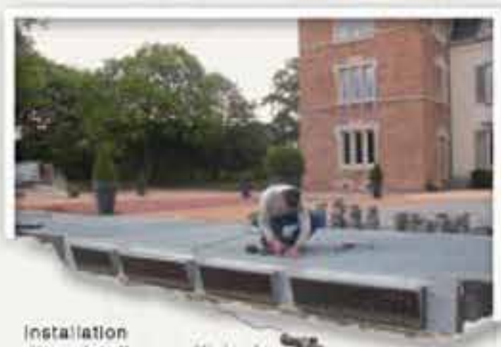
Installation d'un plâtelage caillébotis

Nous intervenons également sur site pour les travaux de maintenance, tels que l'entretien des cuves à hydrocarbure ou encore des réparations sur des réseaux de tuyauteries industrielles.