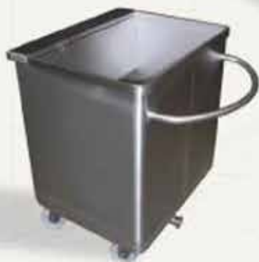
Bac de rétention