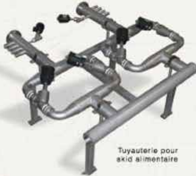
Tuyauterie pour skid alimentaire