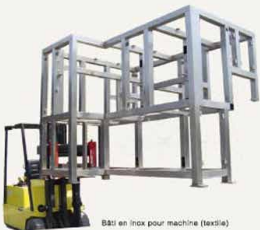
Bâti en inox pour machine (textile)